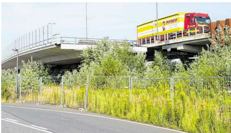
Das Stück Autobahn 281, das mitten in der Stadt einfach so am Neuenlander Ring endet (links), wirkt wie eine Sprungchance. Über den Knotenpunkt Neuenlander Straße/Kattenturmer Heerstraße (rechts) fahren täglich bis zu 70 000 Fahrzeuge, etwa die Hälfte davon passiert den Tunnel.

7 692 240 7500 Euro monatlich als „Sofortrente“ (Alle Angaben ohne Gewähr.)