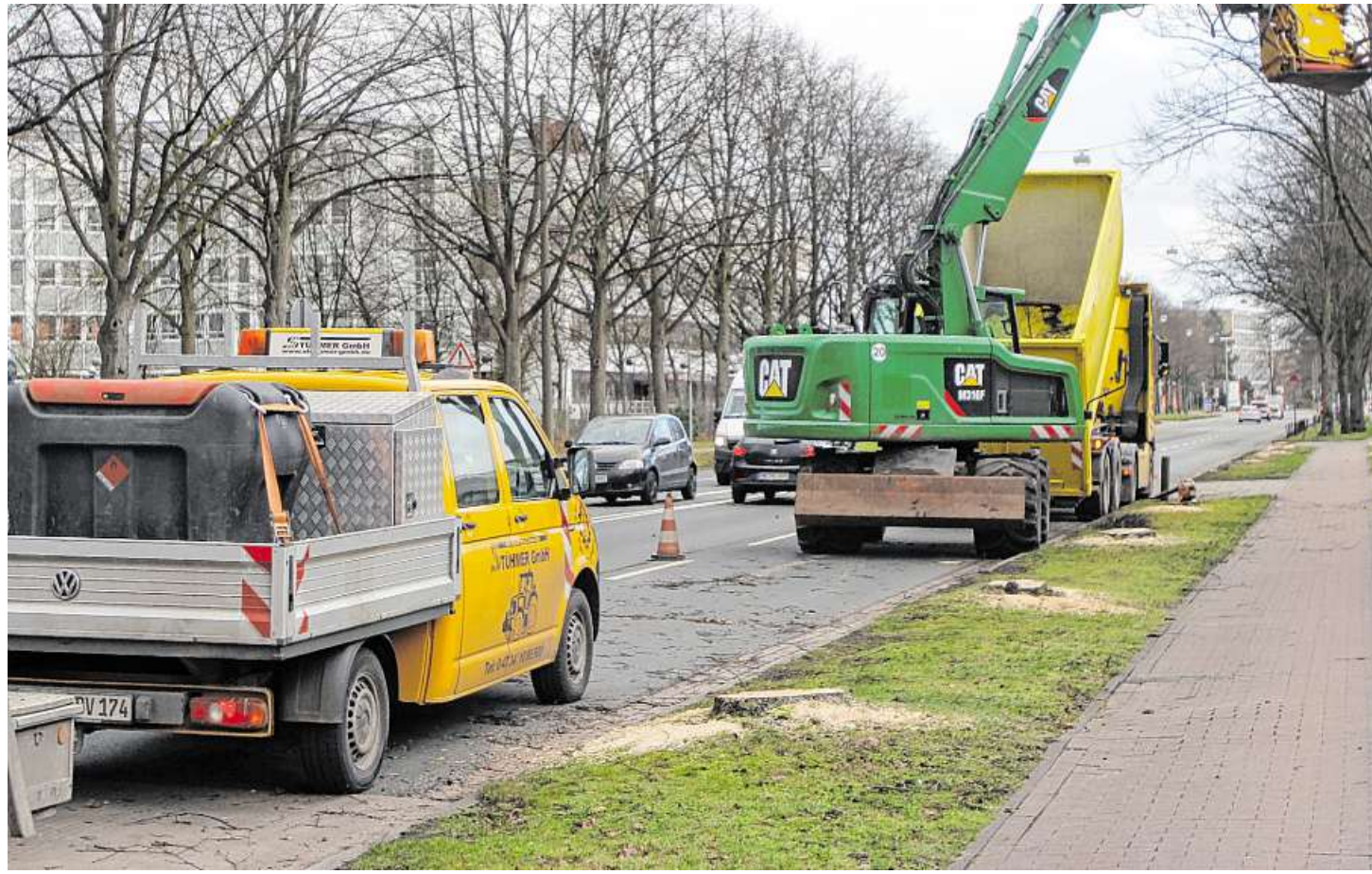
Mit schwerem Gerät kappten die Facharbeiter die Bäume entlang der Stresemannstraße.