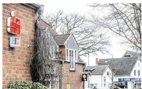
Die Sparkasse in Borgfeld zieht demnächst in das Stiftungsdorf.

Er hatte ausgerechnet, dass es bis zu acht Kilometer seien, die ältere Borgfelder zu-rücklegen müssten, hätte es keinen Standort in Borgfeld mehr gegeben. „Wir sind froh, dass wir die Sparkasse im Ort behalten und danken allen, die das möglich gemacht ha-ben“, sagt Huesmann.