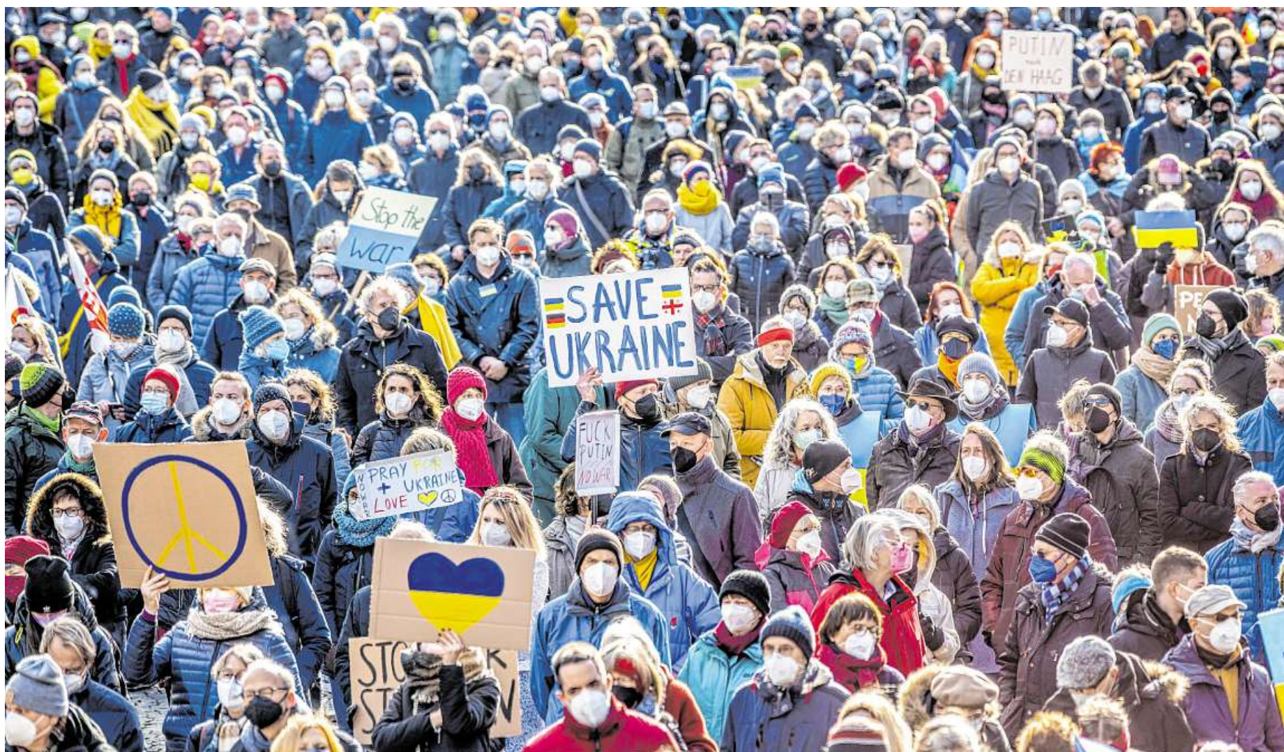
Mehr als 4000 Menschen protestierten auf dem Domshof gegen die russische Aggression in der Ukraine.